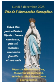
Procession aux flambeaux dans Chatou en l'honneur de la Vierge Marie